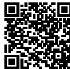
連絡メール2 保護者登録