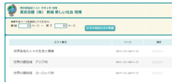
▲教科書ページでテストの範囲を指定