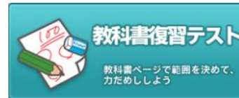
▲使用するコンテンツ