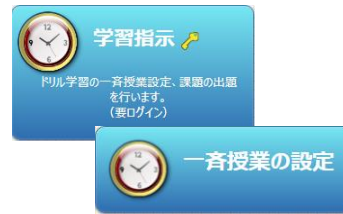
▲使用するコンテンツ

⇒クラス全体の傾向を確認後、[指導教材]から解説教材や確認問題を提示し、要点を再確認します