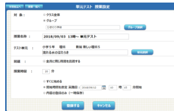
▲日時を予約設定できます