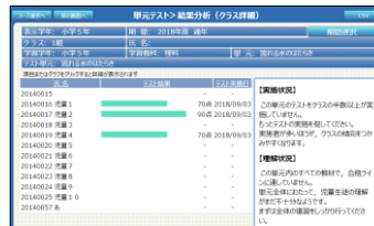
▲クラスや個別の成績を確認