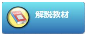
▲使用するコンテンツ