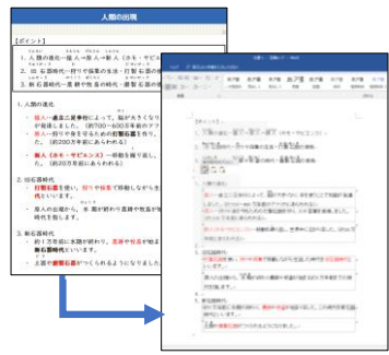
▲解説教材をコピーしてWordに 貼り付ける