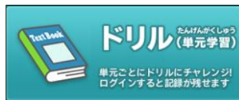
▲使用するコンテンツ