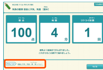
▲次のレベルに挑戦