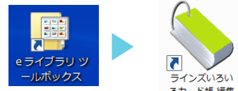
▲使用するコンテンツ

⇒「いろいろカード帳編集ツール」は、インターネット回線を使わずにオフラインで利用できます