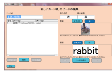
▲先生や児童生徒が撮影した写真を使って作成することも可能