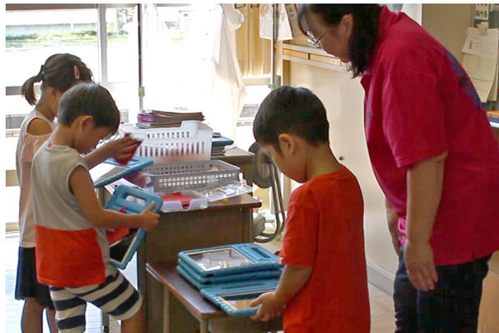
▲ 使用後は画面を拭き、全員で片付け