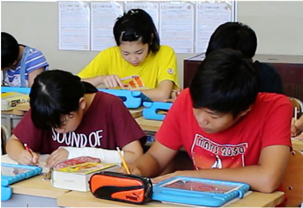
▲机の上に辞書を出し、わからないことは調べながら学習