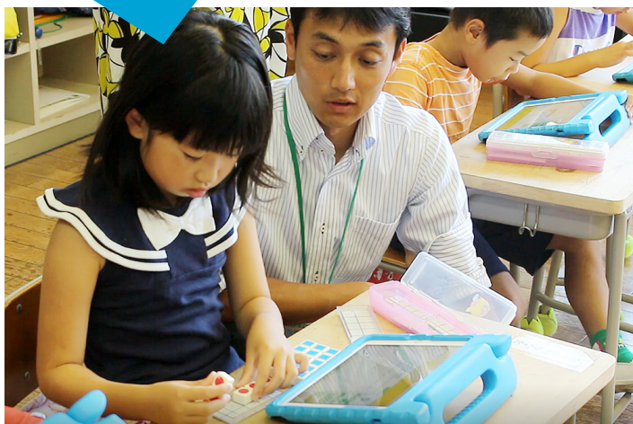
▲ 実際のブロックを使い、先生と一緒に考える

迷うことなく問題を次々と解いていく児童や、実物のブロックを使いながら先生と一緒に考える児童など、 それぞれのペースに合わせた学習 の様子が見られました。