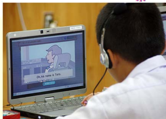
▲ 字幕を表示させて確認しています

得意な生徒は「普通」の速さで聞き取ろう!というチャレンジ精神が芽生える一方、苦手な生徒も自分に合ったやり方でじっくり挑戦することができます。