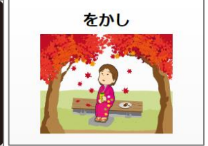
▲古典単語【絵を見て覚える】