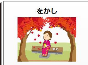
▲古典単語【絵を見て覚える】