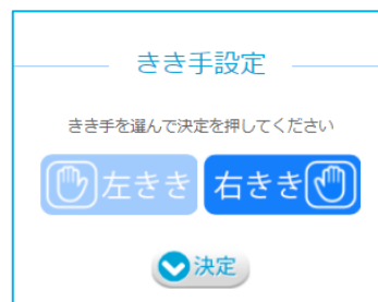
▲きき手設定の画面