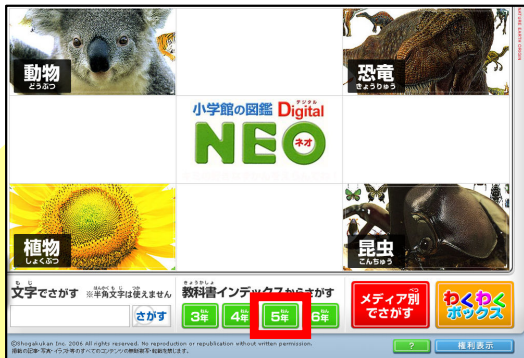
「教科書インデックスからさがす」の「5年」をクリック