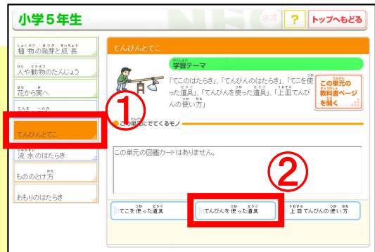
①「てんびんとこ」 → ②「てんびんを使った道具」をクリック