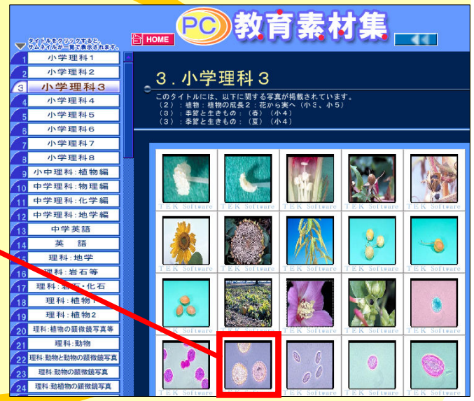
見たい画像をクリックすると拡大表示されます。