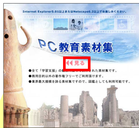
トップページの「見る」をクリック