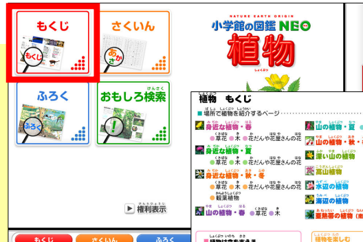
「もくじ」をクリック