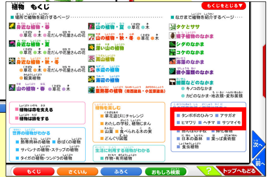
「自由研究や調べ学習に役立つ」の 「アサガオ」や「ヒマワリ」をクリック