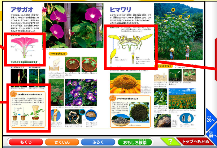
ページ上でクリックすると、拡大された画像 や説明が表示されます