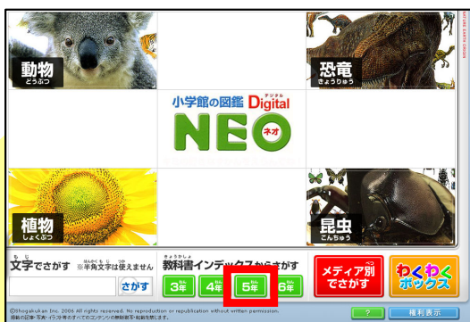
「教科書インデックスからさがす」の「5年」をクリック