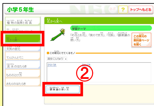
①「花から実へ」 → ②「顕微鏡の使い方」をクリック