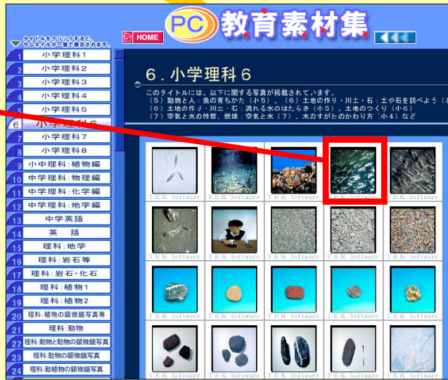
見たい画像をクリックすると拡大表示されます。