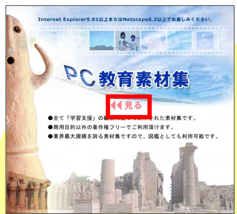
トップページの「見る」をクリック