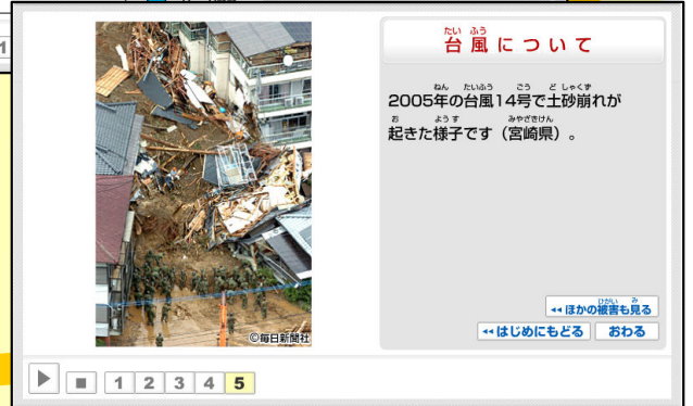
台風の動き方や、雲の様子、災害の様子などを確認することができます。