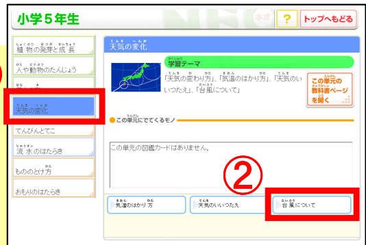
①「天気の変化」 → ②「台風について」をクリック