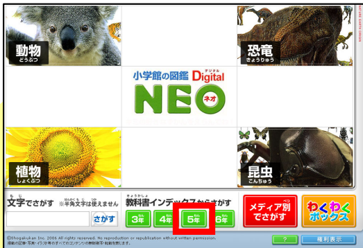
「教科書インデックスからさがす」の「5年」をクリック