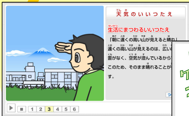
「空」「雲・霧」「生き物」「生活」にまつわる いろいろな天気の違いを確認する ことができます。