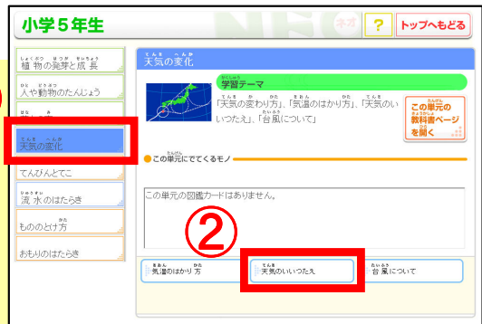
①「天気の変化」 → ②「天気の違い」をクリック