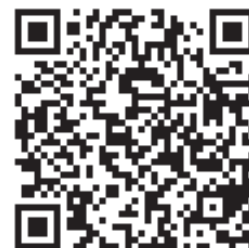
連絡メール2 保護者ログイン