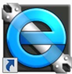
eライブラリ 学校管理者