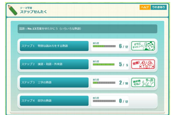
言葉をやたかに5(いろいろな熟語) ステップ選択