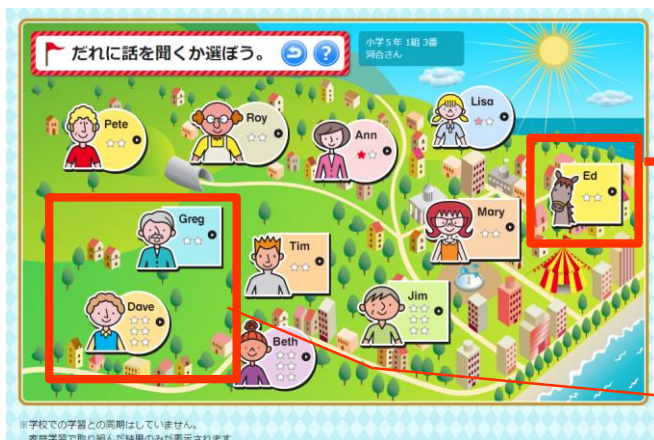
▲ サンセットタウンの住人に話を聞こう