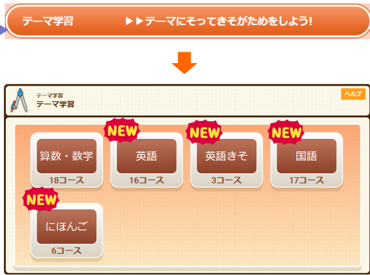
▲ テーマ学習教科一覧