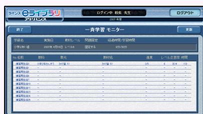
モニタリング画面