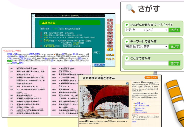
検索される資料の例

百科事典などなら、ハイパーリンクをたどって、さらによくわしく調べていくこともできます!