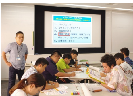
▲ 個人ワークで学校での活用案を模索中！

最初に研修のゴールと流れを共有し、全員が同じ目的意識をもって研修がスタートしました。