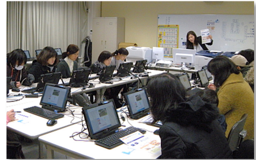
▲ 保護者・地域体験会の様子