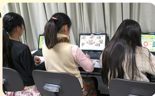
▲ 解説教材やドリルでまとめています

「まとめたい子はまとめる、練習問題をしたい子はドリルをする」というように、 子どもたちが自分のペースで、自分に合った学習スタイルを選んで 進めていきます。