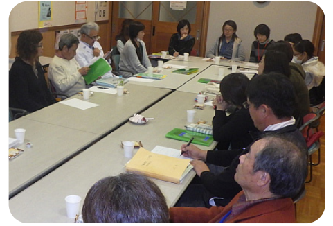
▲ ボランティア会議の様子

環境として塾の少ない地域ですが、その中でも「生徒たちの学力を上げていきたい」という共通の思いを持ったボランティアの方々が一丸となって、生徒たちの学習を見守っています。