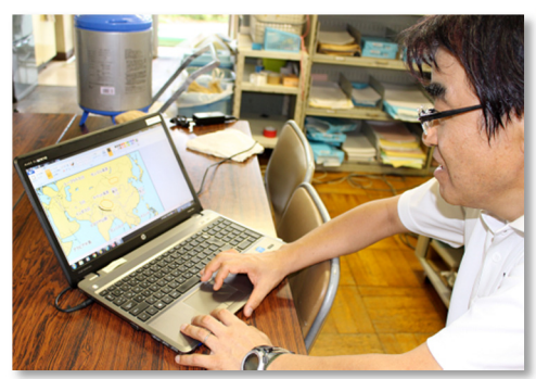
▲ 地図に編集を加えています