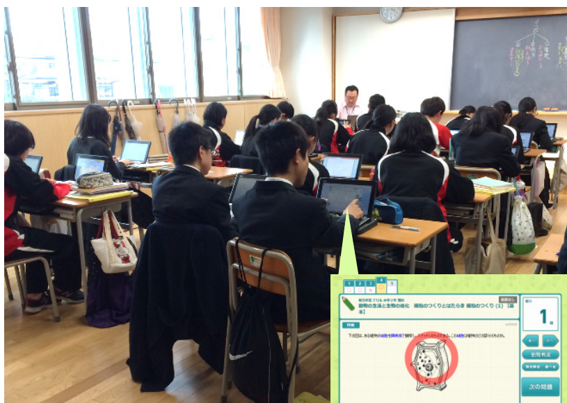
【学習履歴型ドリル】

7時間目の授業が終わるとすぐに生徒は自分のタブレットPCを取り出し、eラーニング学習に15分間取り組みます。