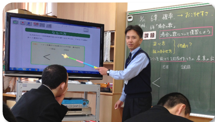
■小中9学年分の要点整理教材を、クラスに合わせて編集しています。

ここで使用したのは小学校内容の「ステープラ教材」です。既存のステープラ教材を中学校内容につながるよう山野先生が編集したもので、例題に合わせて大型テレビに提示し、解説します。