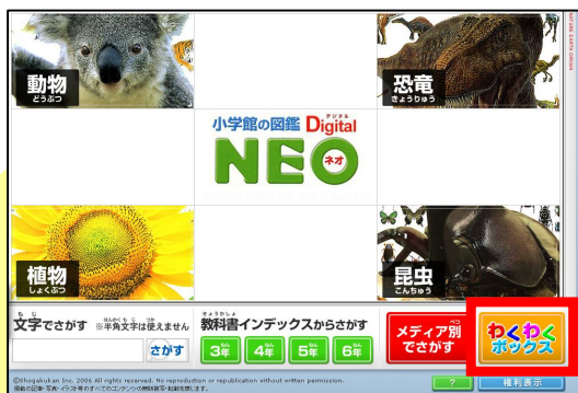
「わくわくボックス」をクリック