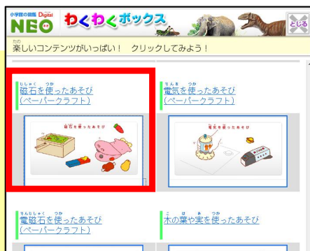
「教科書」の中にある 「磁石を使ったあそび」をクリック