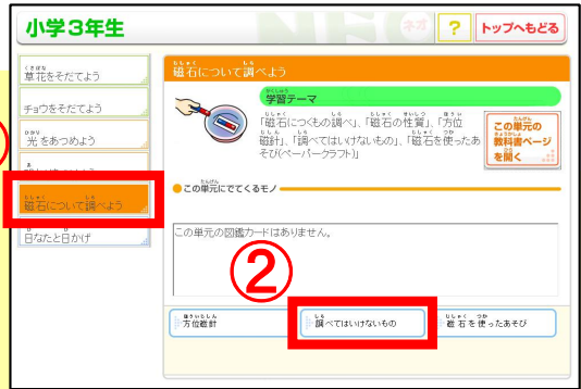
①「磁石について調べよう」 → ②「調べてはいけないもの」をクリック