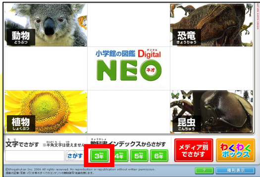
「教科書インデックスからさがす」の「3年」をクリック