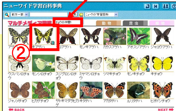
① グループを選択 →② 見たい昆虫をクリック