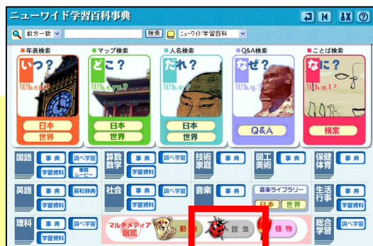
マルチメディア図鑑の[昆虫]をクリック