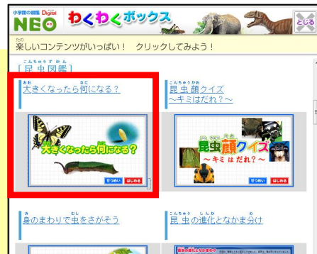
「昆虫図鑑」の中にある「大きくなったら何になる？」をクリック