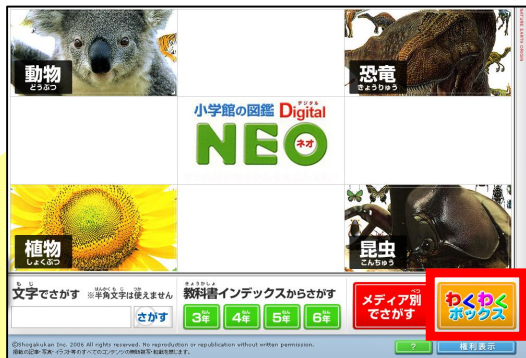
「わくわくボックス」をクリック