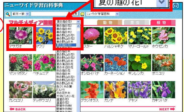
① グループを選択 →② 見たい植物をクリック