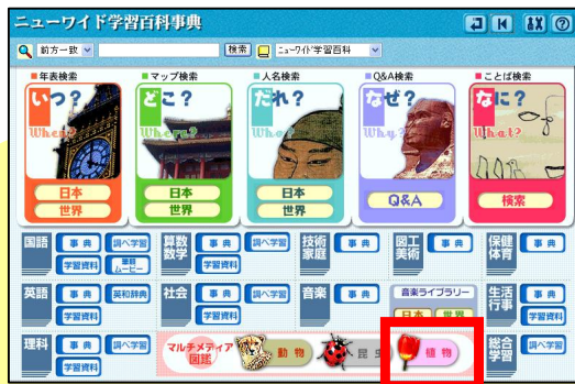
マルチメディア図鑑の[植物]をクリック