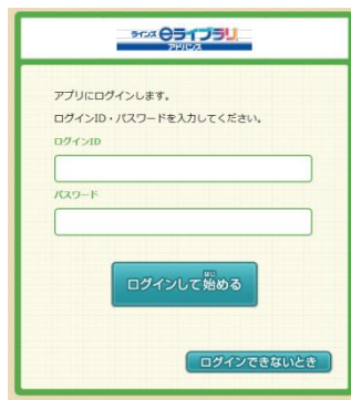
ログイン画面(学習開始時)

・終了した「課題」についても、提出期限までは、内容の参照や再学習ができるようになります。