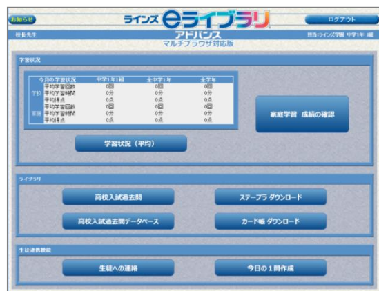
家庭学習 先生トップ

※Internet Explorerの対応バージョンはIE11のみとなります。IE10以前のブラウザでは、ドリルをご利用いただけません。推奨環境のOS・ブラウザでご利用ください。推奨環境の詳細は、家庭学習ログインページ下部のリンクよりご確認ください。